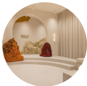
CLAP STUDIO weareclap.com