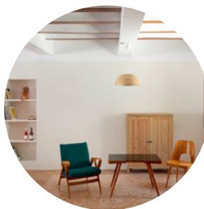
CRUX ARQUITECTOS cruxarquitectos.com